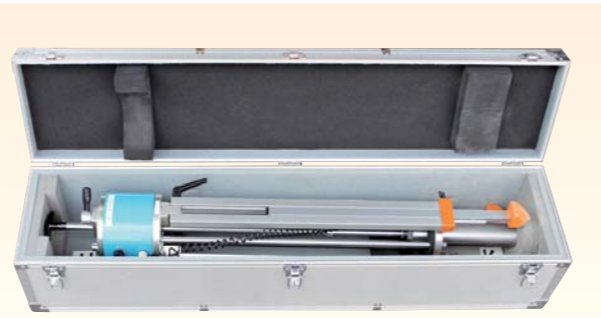
本体 (運搬ケース収納時)

社団法人日本材料学会 平成 14 年 2 月 13 日 技術評価証第 1004 号