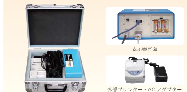
表示器・付属品 (運搬ケース収納時)