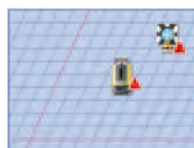
後視点(既知点)測定