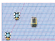
基準軸(原点と基準軸)測定