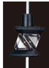
360°スライド プリズム ATP2S