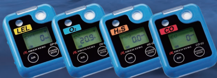
Model GP-03 可燃性ガス用