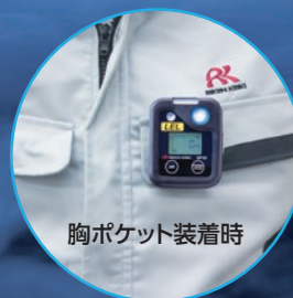
胸ポケット装着時