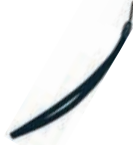
ハンドストラップ