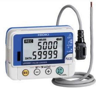
CUZ-LR5061 IP54 (防滴構造)